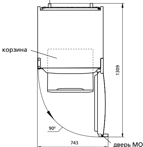
Рисунок 2 – Холодильник (вид сверху)